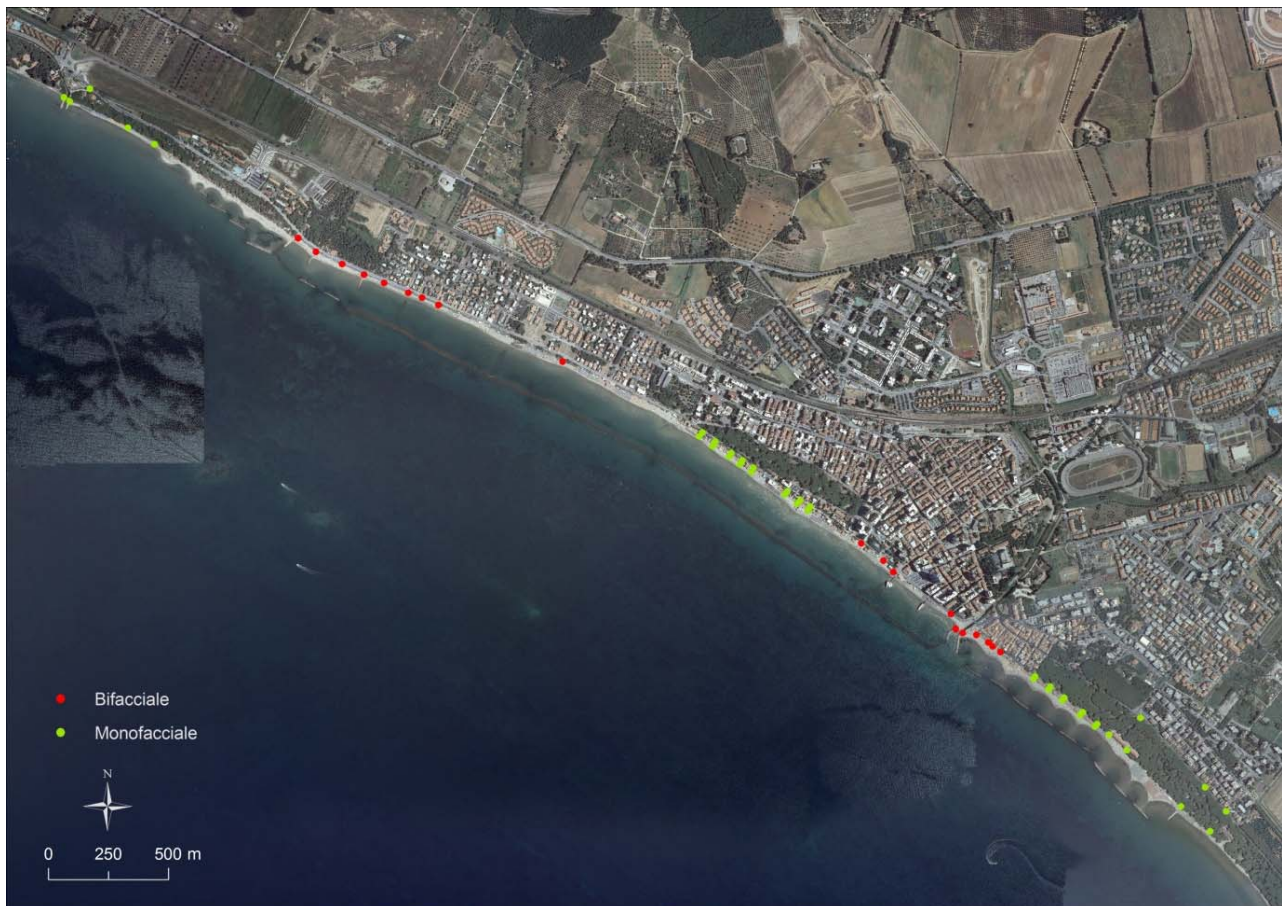
Figura 2 - Posizione dei cartelli nel Comune di Follonica.

Il tratto di litorale compreso nel Comune di Follonica ed interessato dalla cartellonistica si estende dalla località Pratoranieri verso sud est per circa 5,7 km (Fig. 2). Lungo il litorale vi è un susseguirsi di stabilimenti balneari e tratti di spiaggia libera. Anche in questo caso in questi ultimi tratti verranno installati in totale 38 cartelli monofacciali e 19 bifacciali.