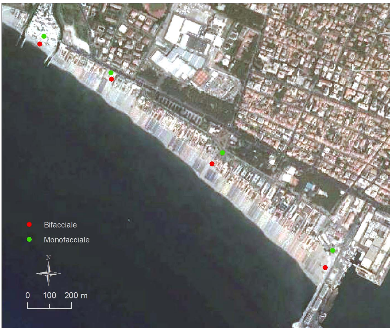
Figura 1 - Posizione dei cartelli nella spiaggia di Marina di Carrara.

Il tratto di costa del Comune di Carrara coinvolto nell'installazione della cartellonistica del progetto I-PERLA si estende per 1,7 km dal torrente Parmignola fino ad arrivare al molo di Ponente del porto di Marina di Carrara (Fig. 1).