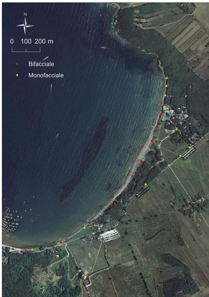
Figura 3 - Posizione dei cartelli nel Golfo di Baratti.

Nel Comune di Piombino il tratto di costa interessato dal Progetto è quello del Golfo di Baratti che si sviluppa tra Poggio San Leonardo a Nord-Est e Punta delle Pianacce a Sud-Ovest. La cartellonistica sarà installata nei 1700 m di arenile che spingono dalla falesia situata a Nord del Golfo ed il limite meridionale della spiaggia.