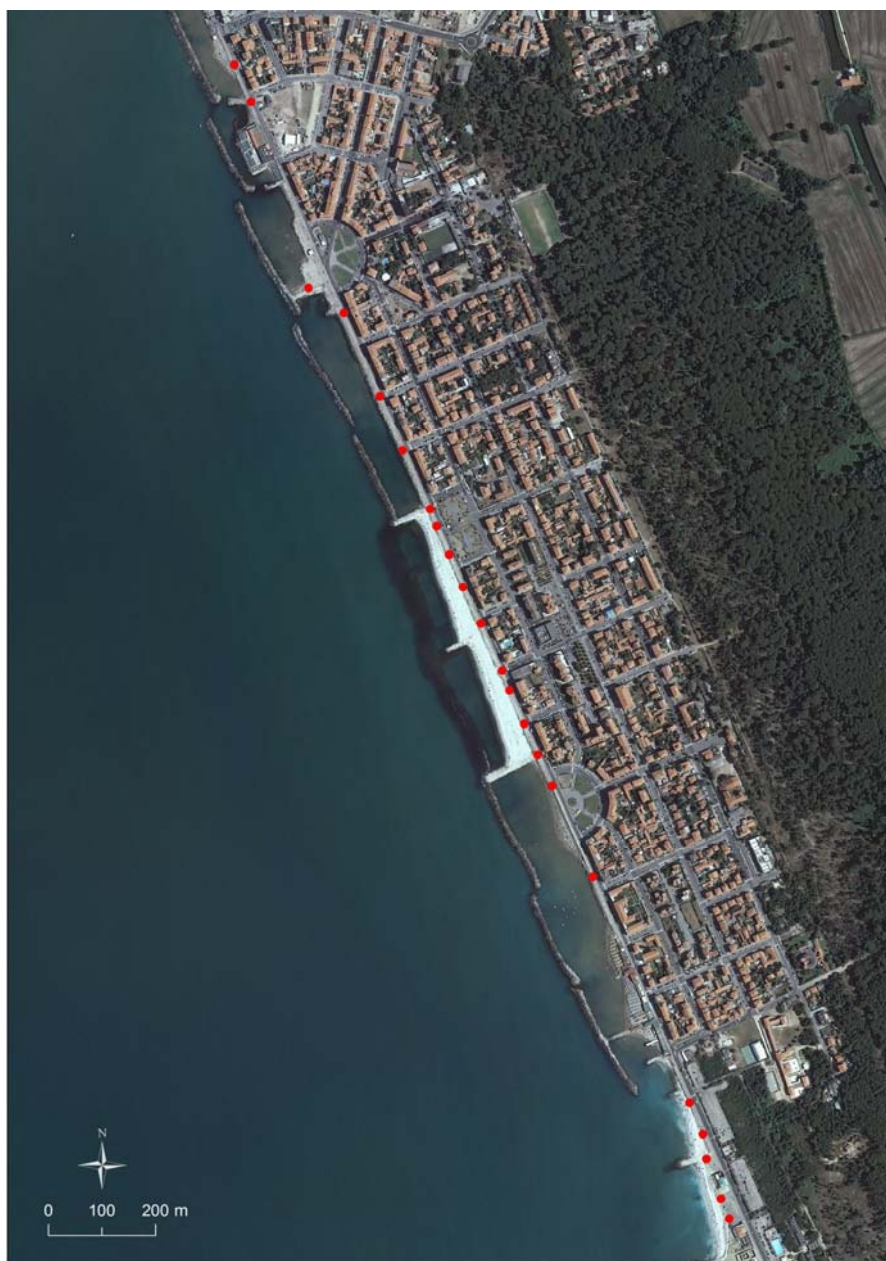
Figura 4 - Posizione dei cartelli a Marina di Pisa.